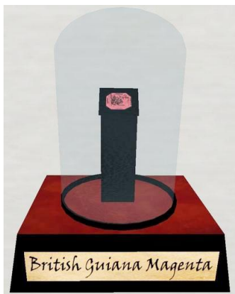
Il francobollo da 1 centesimo magenta del 1856 della Guyana britannica sotto vetro