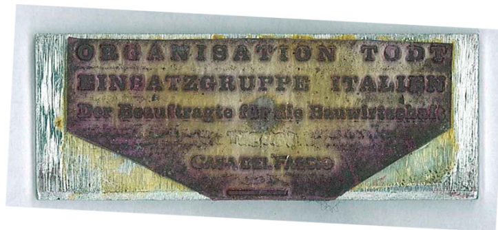
ORGANISATION TODT EINSATZGRUPPE ITALIEN Der Beauftragte für Sie Bauwirtschaft CASA DEL FASCIO