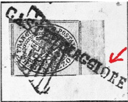
“Castelmaggiore” falso su francobollo annullato con griglia originale del 1855