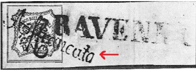
“AFFRANCATA” falso in rosso in corsivo tondo,

Aggiungiamo anche alcune impronte false, discretamente imitate, di Pontificio usate su documenti e/o frammenti: