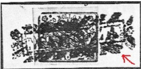
“MAENZA” negativo falso con fregi